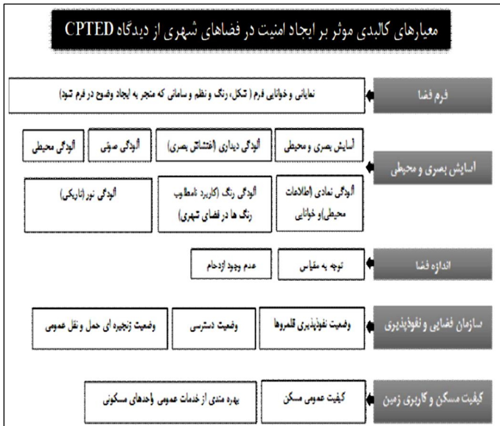
شکل ۱. معیارهای کالبدی مؤثر بر ایجاد امنیت در فضاهای شهری از دیدگاه رویکرد CPTED (Minnery et al., 2005)

جاکوب: جاکوب به مسئله امنیت و نیز عوامل بازدارنده فضایی و کالبدی اشاره نموده است: به نظر وی نشانه یک شهر موفق آن است که فرد در خیابان‌ها و کوچه‌ها و دیگر فضاهای شهر که مملو از غریبه است احساس امنیت و اطمینان کند و نباید خود به خود احساس کند که مورد تهدید است (حاتمی و ذاکر حقیقی، ۱۳۹۹).