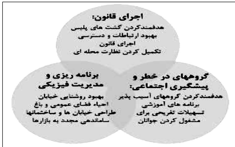
شکل ۲. سه رکن اصلی پیشگیری از جرم.

پت ترلا (۲۰۰۴)، سه رکن اساسی پیشگیری از جرم را در حوزه قانون، پیشگیری های اجتماعی و برنامه ریزی و طراحی های مناسب محیطی می داند که بدون توجه به آن نمی توان از جرائم قابل انتظار در محیط کاست.