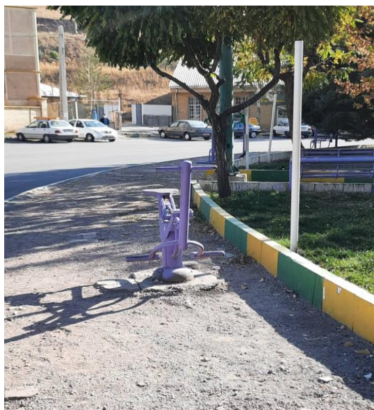
شکل ۴. تصاویری از مبلمان میدان امام خمینی طالقان (شهرداری طالقان، ۱۴۰۰)