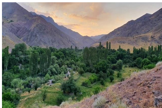
شکل ۲. تصویری از قله شاه البرز (شهرداری طالقان، ۱۴۰۰)