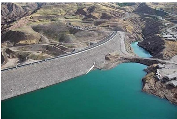
شکل ۳. نمایی از دریاچه و سد طالقان (شهرداری طالقان، ۱۴۰۰)