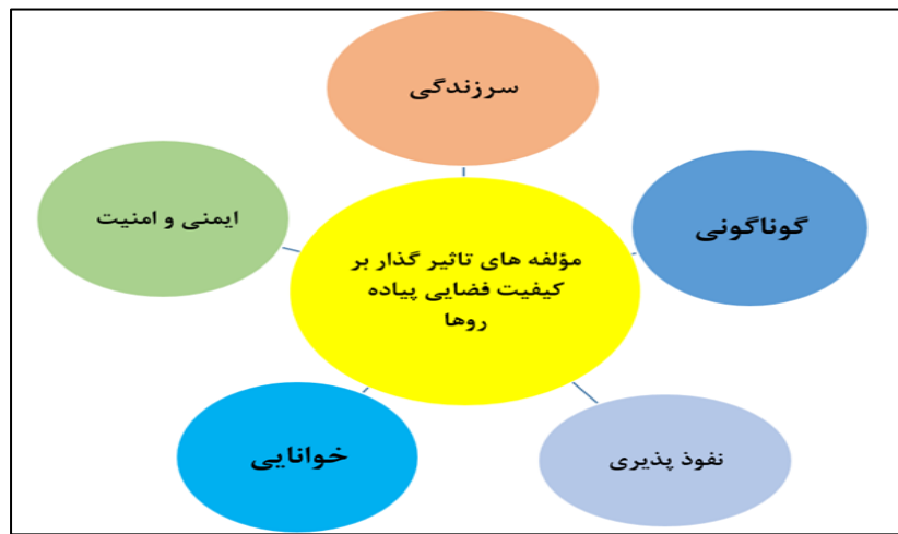
شکل ۲- مؤلفه های تاثیر گذار بر کیفیت فضایی پیاده روها (نگارنده)