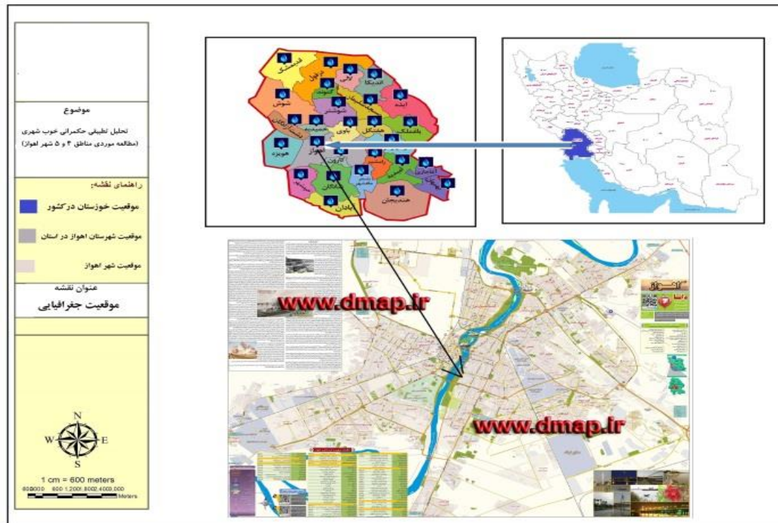
شکل ۱: نقشه موقعیت جغرافیایی محدوده مورد مطالعه

منطقه ۴ از غرب به مسیر پل ششم حدفاصل رودخانه کارون تا بلوار ساحلی، خیابان شهید بهشتی حد فاصل بلوار گلستان تا راه آهن، از شمال بلوار گلستان مسیر پل ششم تا خیابان شهید بهشتی، راه آهن حد فاصل خیابان شهید بهشتی تا خیابان تخت سلیمان، خیابان تخت سلیمان حد فاصل راه آهن تا رودخانه کارون شرق رودخانه کارون حد فاصل خیابان تخت سلیمان تا محدوده شهر. جنوب محدوده شهر حد فاصل رودخانه کارون تا بلوار شهرک پیام محدود می شود. منطقه چهار شهر اهواز به لحاظ موقعیت قرارگیری با منطقه دو و منطقه شش همجوار است و مرز این منطقه را خطوط راه آهن در شمال و غرب و جاده ساحلی و رودخانه کارون در شرق و جنوب تشکیل داده اند و به نوعی سبب شده اند که این منطقه از بخش های همجوار خود منفصل شده و ارتباط نسبتاً ضعیفی با سایر مناطق شهر داشته باشد. از جمله مهمترین عملکردهای موجود در این محدوده می توان به اراضی وسیع متعلق به مراکز آموزش دانشگاهی به ویژه دانشگاه چمران اشاره کرد. منطقه چهار در سال ۱۳۷۱ تاسیس این منطقه با وسعتی معادل ۳۸۲۹ هکتار دارای چهار ناحیه خدماتی و سه ناحیه فضای سبز است (زویداویان زیاری، ۱۴۰۲: ۴۷).