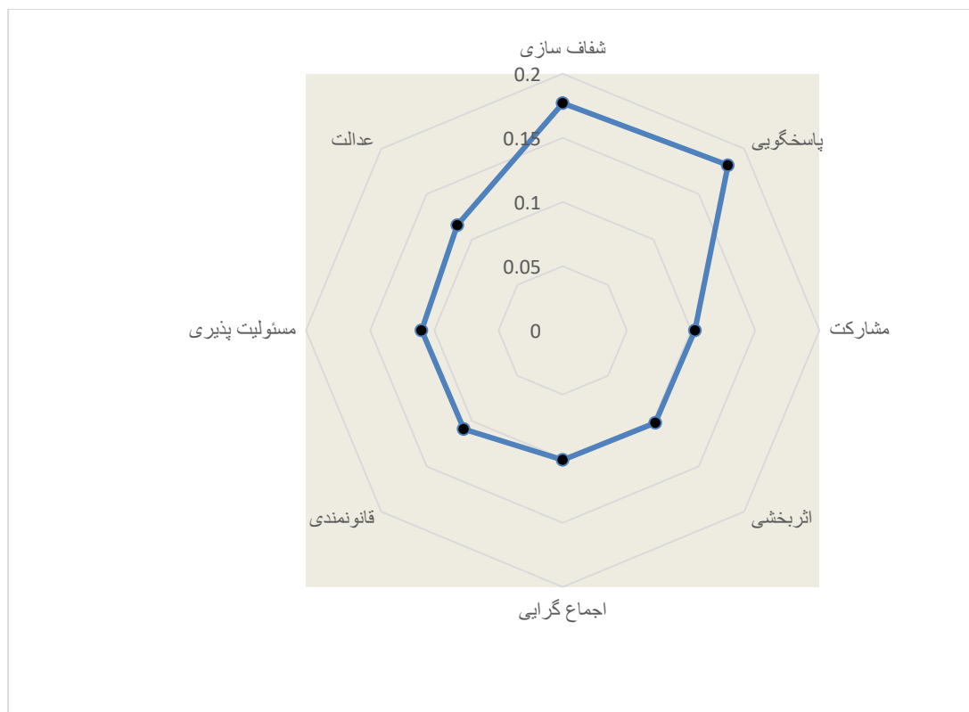
شکل ۲: نمودار مقایسه وزن شاخص های حکمروایی خوب شهری