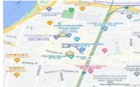
شکل ۵ نقشه های ساختاری محدوده بازار هیسمن تایپه