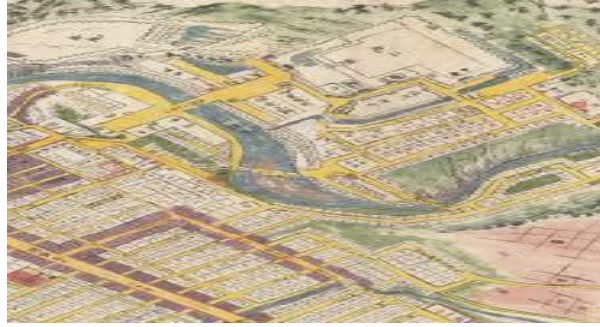
شکل ۱۱ نقشه های ساختاری پروژه سندای ژاپن