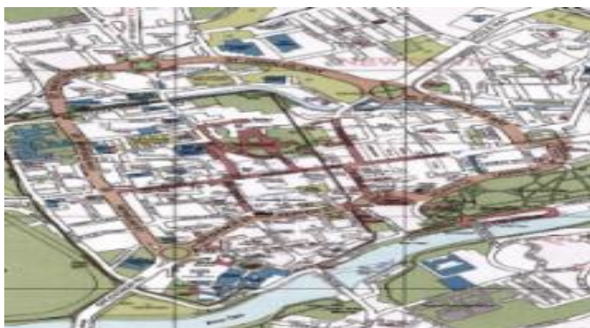
شکل ۲- نقشه ساختاری محدوده در شهر چستر انگلستان

از جمله سیاست‌های کالبدی شهر چستر است. افزایش استفاده فرهنگی هر فرد از جمله احداث تالار عمومی شهر، کتابخانه مرکزی، تئاتر شهر در رأس برنامه‌های پروژه نوسازی قرار دارد. در این طرح طبقه همکف به فروشگاه‌های خرید و قسمت مسکونی به صورت ویلا و آپارتمان در اطراف میدان مرکزی قرار گرفته است. علاوه بر موارد فوق، حمل و نقل عمومی مرکزی و پارکینگ خودرو برای رفع نیاز بازدیدکنندگان در نظر گرفته شد. ( www.hopkins.co.uk ). پروژه احیا که در بالا ذکر شد نمی‌خواهد یک مرکز تجاری جدید ایجاد کند، بلکه سعی می‌کند خیابان‌ها و میدان‌های کوچک موجود را بهبود بخشد تا آنها را به هم متصل کند. به طور کلی کاربردهای این پروژه شامل مواردی همچون مرکز خرید خطی (ترکیبی از مغازه‌های کوچک و بزرگ در اطراف خیابان‌ها)، کافه‌ها و رستوران‌ها و مراکز تفریحی، مرکز تجاری جدید (Hall Market) با توسعه مرکز قدیمی، سینما چند بعدی، هتل، پارکینگ خودرو (با ظرفیت ۸۰۰ خودرو)، ایستگاه‌های جدید اتوبوس، ایجاد ۲۸۰۰ فرصت شغلی می‌باشد.