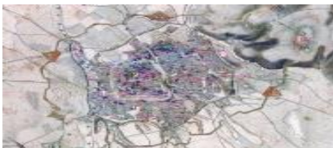
شکل ۹ نقشه حصار تاریخی شهر ارزروم