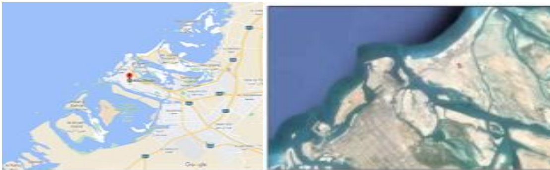
شکل ۸ نقشه ساختاری محدوده کلونی و دینگ برلین آلمان

چشم انداز اقتصادی ابوظبی تا سال ۲۰۳۰ است که توسط شرکت سرمایه گذاری توسعه گردشگری تهیه شده است. این یک پروژه بلند مدت و واقع بینانه است. ابوظبی می خواهد ساختمانی با ثبات، متنوع و با ارزش اقتصادی بالا بسازد که بتواند تا سال ۲۰۳۰ وارد اقتصاد جهانی شده و در آن رقابت کند و در عین حال فرصتی برای افزایش ارزش افزوده برای ساکنان و شهروندان فراهم کند (توسعه گردشگری شرکت سرمایه گذاری، ۲۰۱۳). جزیره سعیدیات. توسعه شرکت نیز بخشی از این دیدگاه را نشان می دهد. در حالی که رویکرد موزه محور به برندسازی شهری بسیار شبیه به نمونه های دیگر است و می توان آن را مناسب دانست، برای منطقه فرهنگی ابوظبی به طور کلی بسیار جالب و عجیب است زیرا مساحت پروژه بسیار بزرگ است. خوب و جمعیت بسیار کم است (Elsheshtawy, 2012; 133) توسعه مکان های فرهنگی یک استراتژی مهم برای تنوع بخشیدن به منابع اقتصادی امارات است. به اقتصاد کمک می کند، میلیون ها گردشگر را جذب می کند، جمعیت را جذب می کند و آنها را از اقتصاد تک محصولی (نفتی) تا ۱۵ الی ۲۰ سال نجات می دهد. (Aspden, 2011)