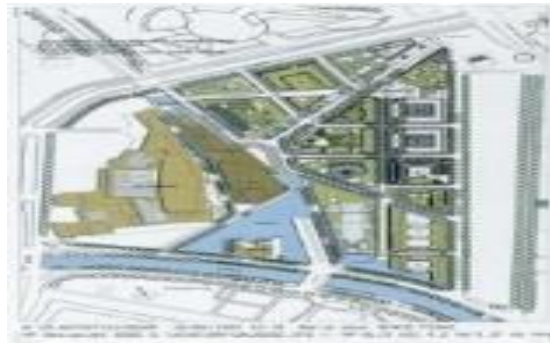
شکل ۱۰: نقشه های ساختاری میدان پوتسدامر برلین