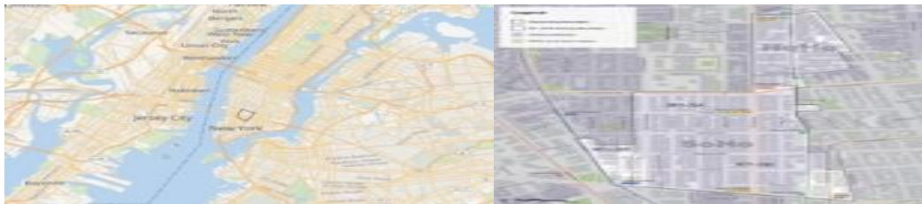
شکل ۳ نقشه ساختاری محدوده محله سوهو در شهر نیویورک

محله سوهو در سال ۱۳۷۱ در نیویورک ظاهر شد و به شهرت رسید. این محله که در واقع یک منطقه صنعتی قدیمی بوده است به مرور زمان به دلیل ویژگی های ذاتی خود که به عنوان محله ای هنری مورد توجه برنامه ریزان قرار گرفته به محل تجمع آتلیه ها و فضاهای هنری تبدیل شده است. محله سوهو واقعاً محله ای خودسامانده با ماشین ها بود، نه محله خلاقانه برنامه ریزی شده، موفقیت این محله باعث شد برنامه ریزان شهر نیویورک به فکر تولید فضاهای خلاقانه کوچک و در عین حال تلفیق کار و زندگی بیفتند. (Braslow, Zukin, 2011, 131). با تبدیل ساختمان یک کارخانه قدیمی در محله Bushwick که در حال حاضر به مرکز خرید Wyckoff تبدیل شده است در بخش ایجاد فضای هنری و فرهنگی پیش قدم شده و با مهاجرت گروهی و وجور شهرت بناها و همچنین جلوه های بصری موجود در خیابان ها باعث کشف مجدد اجتماع محلی میگردد. همچنین اصلاح ساختار ناقص و انعطاف پذیر در برخی قوانین کار و سکونت و توافق نامه های تجاری سبب نوسازی بافت محله گردیده است.