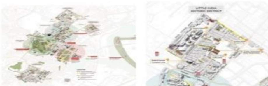
شکل ۴ نقشه های ساختاری محدوده کلارک کوای سنگاپور

(U.R.A.) با روند بازسازی از سال ۱۹۸۳ آغاز و گنجاندن اقداماتی از قبیل ایجاد ترکیب کاربری های جدید متناسب با بافت تاریخی، مرمت بناهای قدیمی و جان بخشیدن به کل مجموعه، کاشت در حاشیه آب و احداث مسیر پیاده روی ۱۰ تا ۱۵ متری با پارک های کوچک و اجرای طرح برنامه کارهای هنری و همچنین تبدیل بیش از ۶۰ انبار به نزدیک به ۲۰۰ رستوران، مغازه و مرکز خرید از جمله اقداماتی است که در منطقه کلارک وارف انجام شده است. اصول مرمت در پروژه اسکله کلارک شامل حذف کاربری های ناسازگار، برنامه ریزی اقدامات زیست محیطی و بهداشتی (فاضلاب و دفع آب های سطحی)، توجه به رفاه مشاغل محلی و استفاده از نیروی کار محلی در رفاه و مدیریت اقامتگاه های گردشگری است. زیبایی شناسی منظر شهری، نوسازی کاربری و فعالیت با تاکید بر افزایش سطح دانش عمومی، ایجاد کاربری های اوقات فراغت، ارتقای گردشگری فرهنگی با توجه به مشارکت مردمی، ویژگی های میراث طبیعی و ظرفیت محیطی، پژوهش جامع پیش از مداخله، مستمر عمومی آموزش، مشارکت ساکنان اگرچه ظاهر اسکله مانند قبل است اما کیفیت کاملاً متفاوتی پیدا کرده است. فروشگاه های خرده فروشی، رستوران ها، تفریحات شبانه، آب نماها و فواره ها گردشگران اروپایی و ژاپنی را به این منطقه آورده و طراوت و نشاط خاصی به آن بخشیده است. علاوه بر این، بهبود شرایط محیطی رودخانه و دسترسی به اسکله در رونق اقتصادی و جلب توجه مردم محلی موثر بوده است.. (رفیعیان، بمانیان، ۱۳۹۸، ۱۴۱).