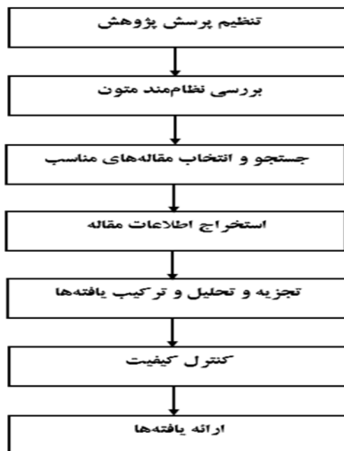
شکل ۱. مراحل هفت‌گانه فراترکیب (سندلوسکی و باروسو، ۲۰۰۳)