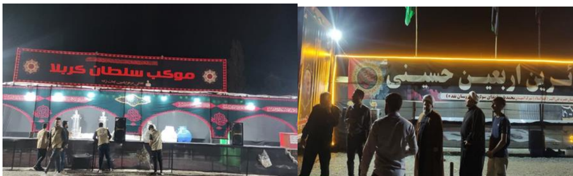
شکل ۲. آماده سازی مواكب حسینی