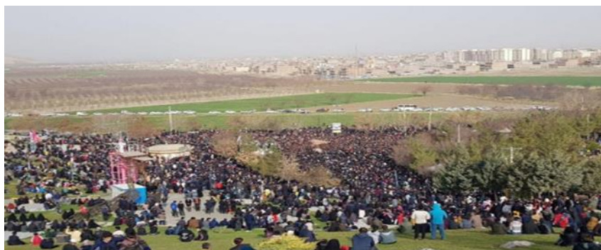
شکل ۴. همایش پیاده روی خانوادگی (نگارندگان، ۱۴۰۲)