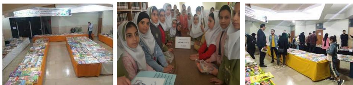
شکل ۵. برگزاری نمایشگاه کتاب (نگارندگان، ۱۴۰۲)

در این نمایشگاه کتاب هایی از انتشارات مختلف با موضوعات تاریخی، دینی، فلسفی، پزشکی، ادبی، اجتماعی، فرهنگی و کودکان است که با هماهنگی و تمهیدات اعمال شده با تخفیف ویژه در اختیار علاقمندان قرار گرفته است. هدف از برگزاری این نمایشگاه ترویج و توسعه فرهنگ مطالعه، توسعه و تعمیق فرهنگ کتابخوانی و جذب کتاب‌های تازه و مربوط به سال‌های اخیر است چراکه مردم امروز بیشتر به دنبال خواندن کتاب‌های تازه، تخصصی و مفید هستند بنابراین تلاش شده است که این نمایشگاه در سطح کیفی خوبی برگزار شود.