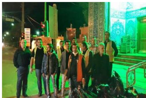
شکل ۳. طرح همیار پاکبان (نگارندگان، ۱۴۰۲)