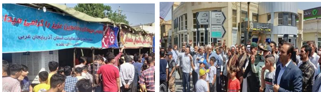
شکل ۶. ایستگاه های فرهنگی عید غدیر خم (نگارندگان، ۱۴۰۲)

شهرنقده در عید بزرگ اسلامی؛ عید غدیر خم با ایجاد موبک های پذیرایی از مردم، راهپیمایی غدیر و برگزاری جشن های متعدد غرق در شادی بود.